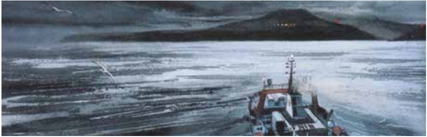
Voyage aux îles de la désolation, pg50, Emmanuel Lepage © Futuropolis