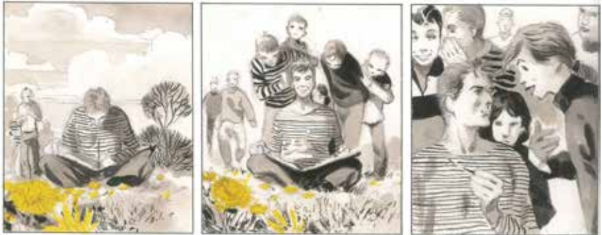
Un printemps à Tchernobyl, Emmanuel Lepage

Met deze gids kan je deze tijdelijke tentoonstelling van het Stripmuseum bezoeken en het geweldige werk van deze striptekenaar verkennen. Goede reis!