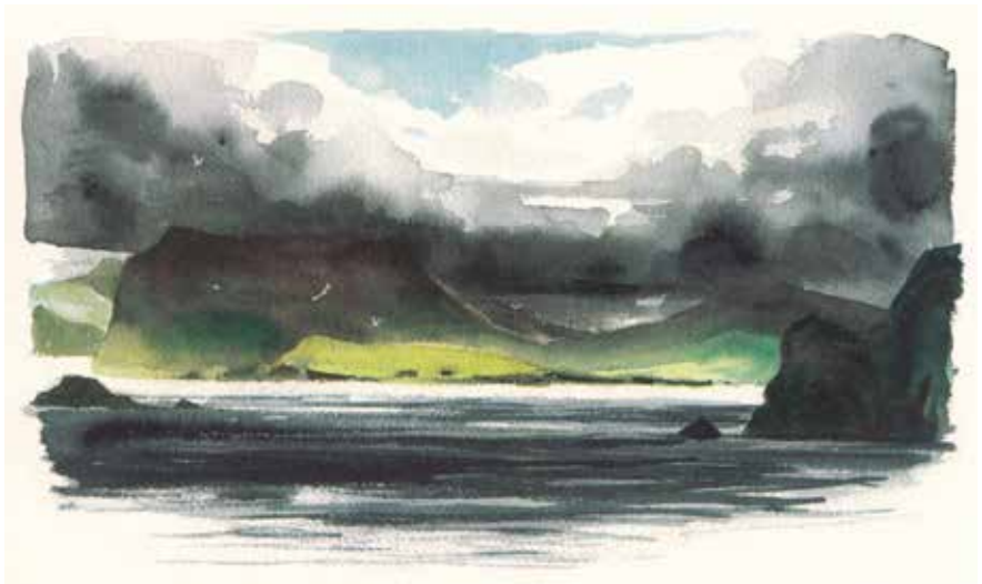
Voyage aux îles de la désolation, pg107, Emmanuel Lepage © Futuropolis