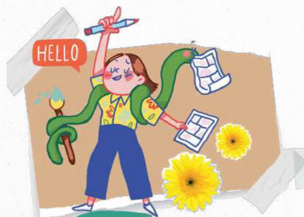
Originele illustratie van Karolina Szejda

De reizende striptentoonstelling De Stripfabriek is een spannende educatieve ervaring voor kinderen van 6 tot 10 jaar. Het biedt de mogelijkheid om de fascinerende wereld van het stripverhaal te ontdekken, met aandacht voor de codes en de stadia van creatie, evenals de productieketen van het boek. Kinderen maken ook kennis met de verschillende stripgenres, met originele illustraties van de Belgische auteur Karolina Szejda ( Tram 5 en Love me Tinder ).